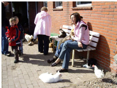
Mensen en dieren genoten zichtbaar van het samenzijn

Iedereen heeft op zijn of haar gemak tussen de dieren rondgelopen en alles rustig kunnen bekijken, al dan niet onder het genot van een hapje en een drankje. De reacties waren over het algemeen genomen positief, er waren zelfs een aantal mensen die gelijk aanboden vrijwilligerswerk te willen komen doen, van wie er al een aantal ook daadwerkelijk begonnen zijn. We kijken met een goed gevoel terug op deze eerste open dag in Duitsland en hopen dat het volgend jaar weer zo'n succes zal zijn.