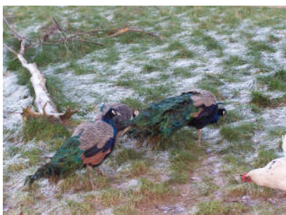
de pauwen met z'n drieën